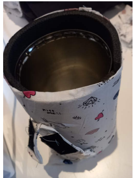
J'y glisse le morceau de tapis de sol et la boîte métallique