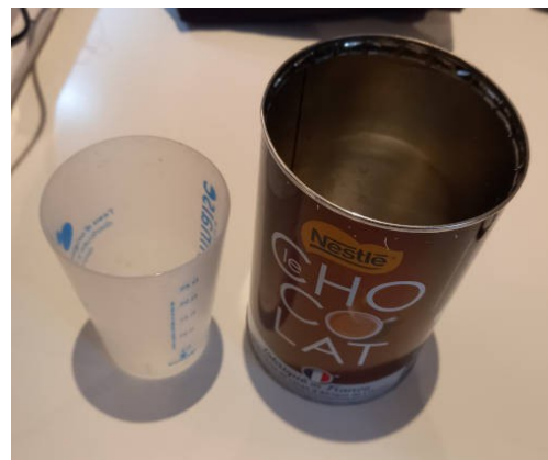
un verre en plastique et une boite métallique de cacao (vide)