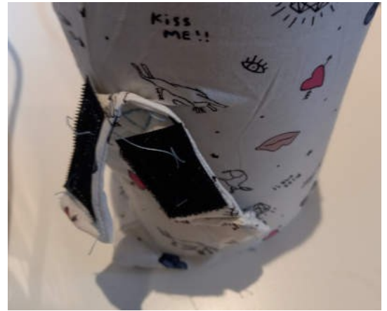
le petit lien avec velcro