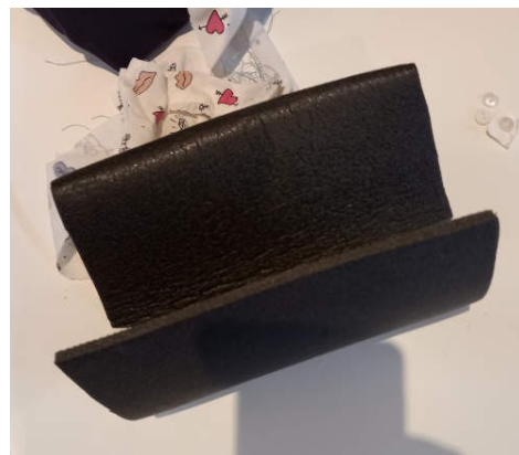
un morceau de tapis de sol en mousse