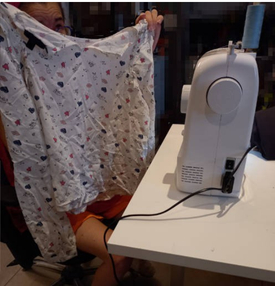
Un vieux chemisier

Moi j'ai utilisé un vieux chemisier que j'ai découpé et cousu, deux verres en plastique pour donner la forme au tissu et le rendre plus facile à utiliser, une boite de cacao en métal pour transporter facilement une bouteille (et de la mousse de tapis de sol pour tendre le tissu), et un petit morceau de velcro .