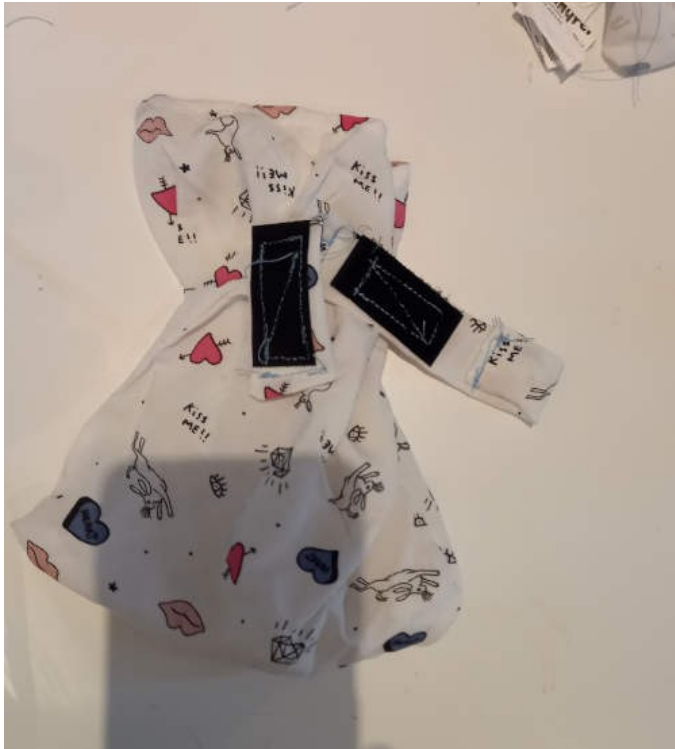
Le morceau cousu pour le porte bouteille avec le lien et le velcro